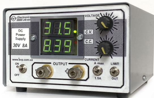
Мал. 1. Імпульсне джерело живлення постійного струму Lab Mini 30V 8A