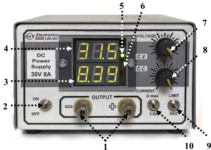
Мал. 2. Розташування органів управління на передній панелі джерела живлення