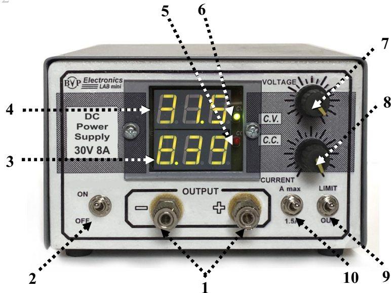
Мал. 2. Розташування органів управління на передній панелі джерела живлення