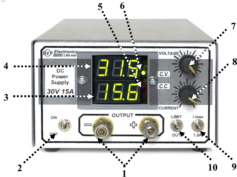
Мал. 2. Розташування органів управління на передній панелі джерела живлення