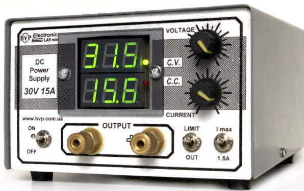
Мал. 1. Імпульсне джерело живлення постійного струму Lab Mini 30V 15A