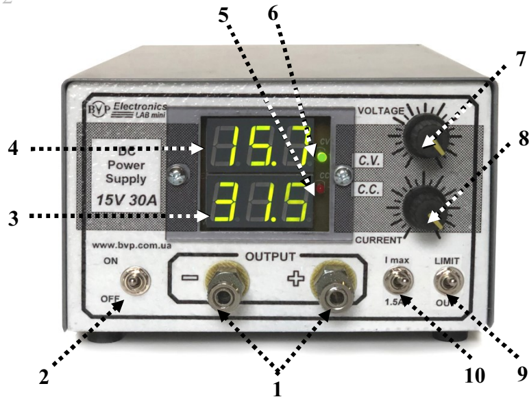
Мал. 2. Розташування органів управління на передній панелі джерела живлення