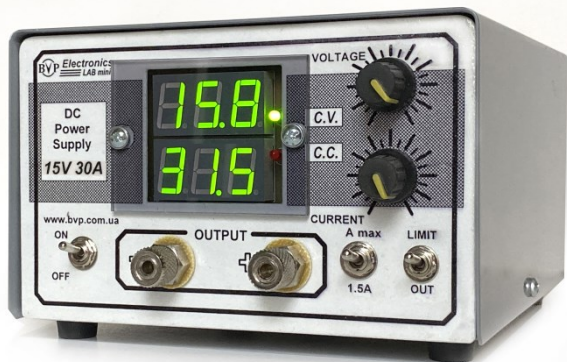
Мал. 1. Імпульсне джерело живлення постійного струму Lab Mini 15V 30A