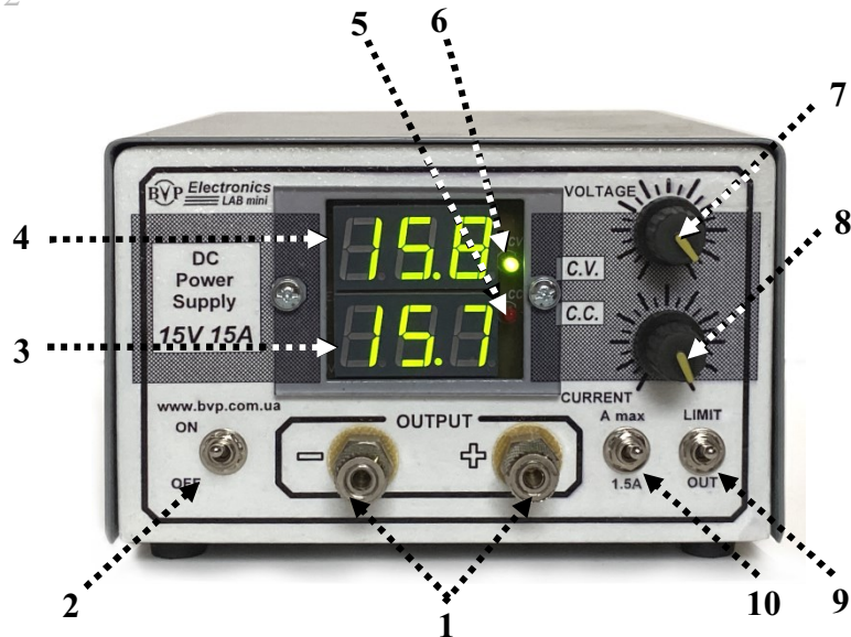
Рис. 2. Расположение органов управления на передней панели источника питания