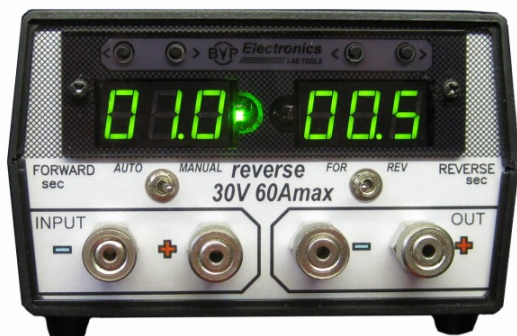
Рис. 1. Блок реверсного переключения выходного тока BVP REVERSE 30V 60A