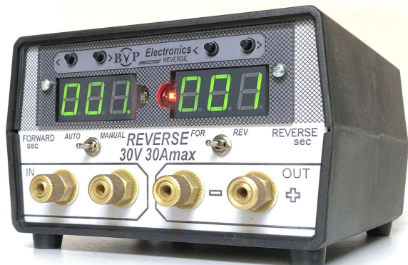
Рис. 1. Блок реверсного переключения выходного тока BVP REVERSE 30V 30A