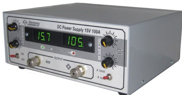
Рис. 1. Импульсный источник питания постоянного тока BVP 15V 100A