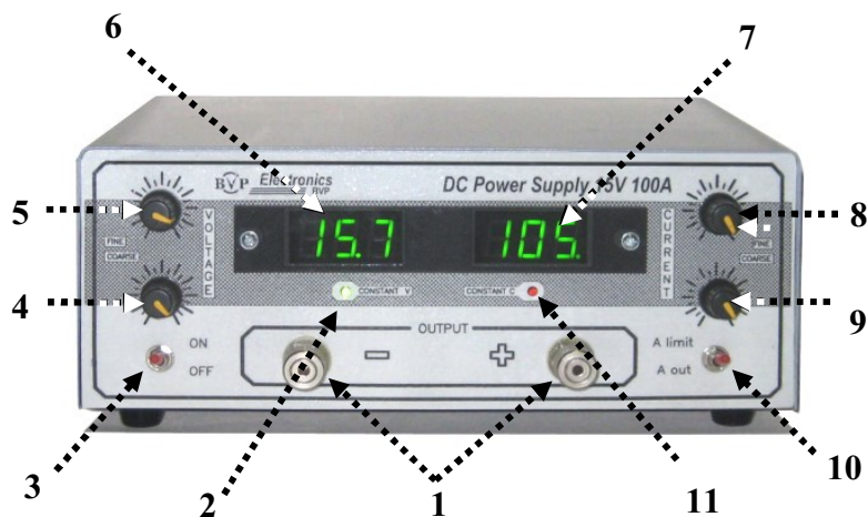
Рис. 2. Расположение органов управления на передней панели источника питания